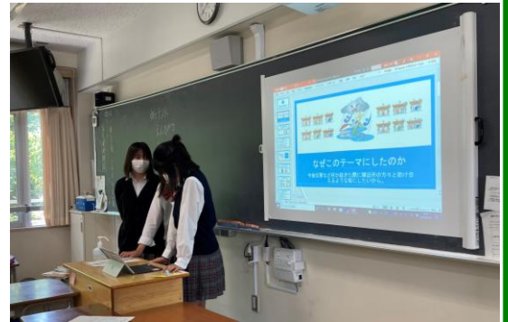
発表をしている様子①